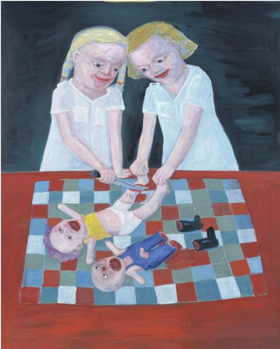
Lena Cronqvist, "Operation", 2001.